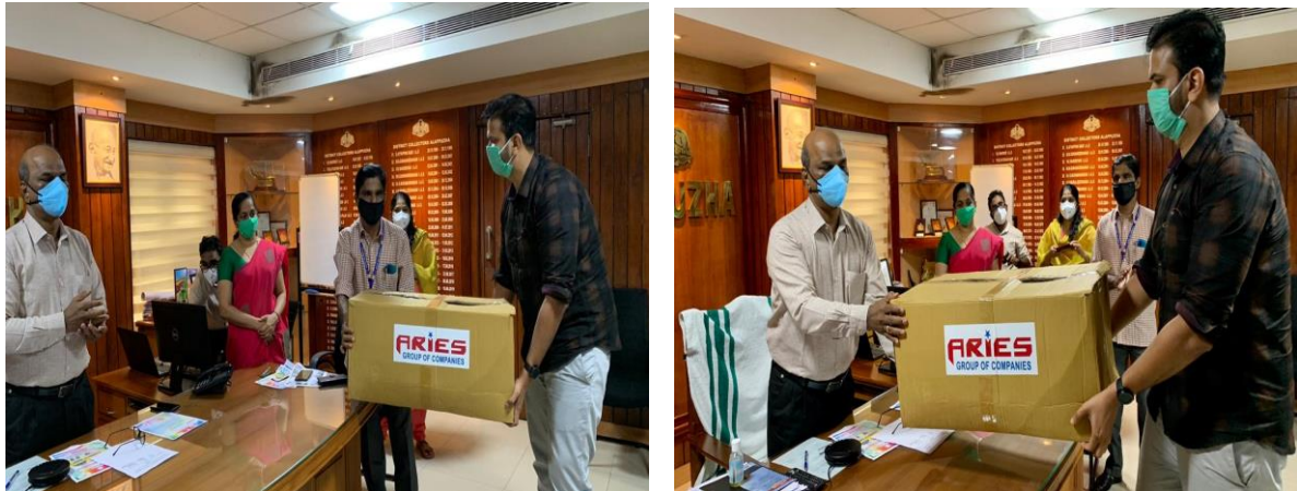
Figure 6- Distribution of Covid preventive articles to the old age and specially abled peoples

The programme started with an introduction of the importance of the International Disaster Risk Reduction Day. During the inauguration, the District Collector introduced the theme of this year and the innovative programmes that are happening in the Alappuzha district in the field of disaster risk reduction. The main attraction of the programme was the distribution of equipments, masks, sanitizer and other materials to the specially challenged people and old age people in the district to equip themselves in the fight against corona. IAG representatives handed over these materials to the collector and the district social welfare department. These kin of timely interventions are really helpful for the empowerment of marginalised peoples.